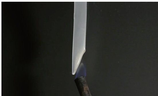
PP に 9% 添加 (0.8mm V-0)